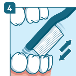
4 Dents de devant : placer la brosse verticalement en allant toujours de la gencive vers la dent.